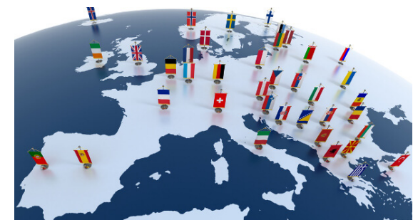
Bis jetzt über 100 Kunden europaweit: