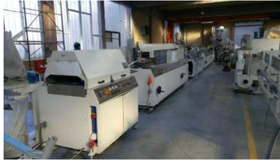
Wir haben 14 Extruderlinien.