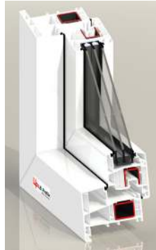
PCD82 XT 6/7