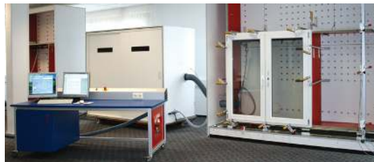
Qualitäts- und Sicherheitskontrolle für Fenster und Türen nach Europäischen Normen.