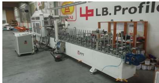
Wir haben 2 Maschinen zum Auftragen von Folien auf Profile.