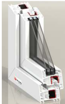
PCD82 MD 7/7