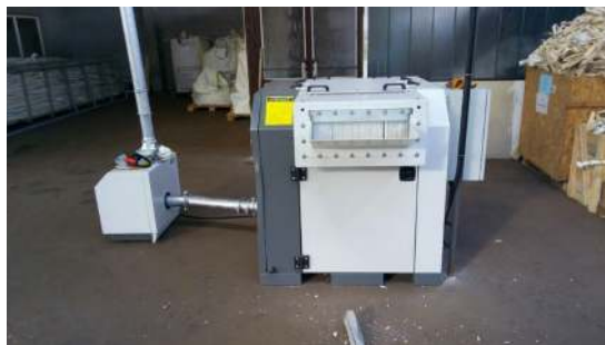
Recycling Anlage Tria.